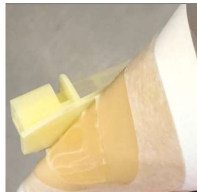
Exemple de séparation possible