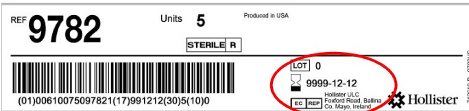
Exemple d'étiquette latérale sur la boîte