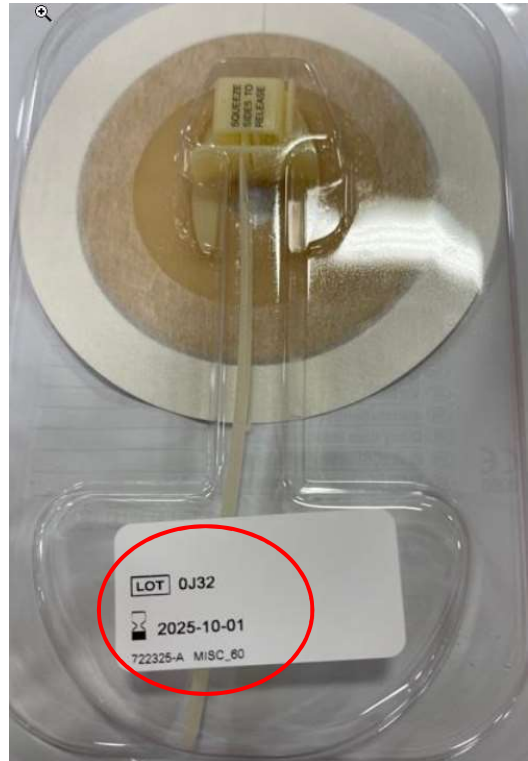
Exemple d'emballage individuel du produit